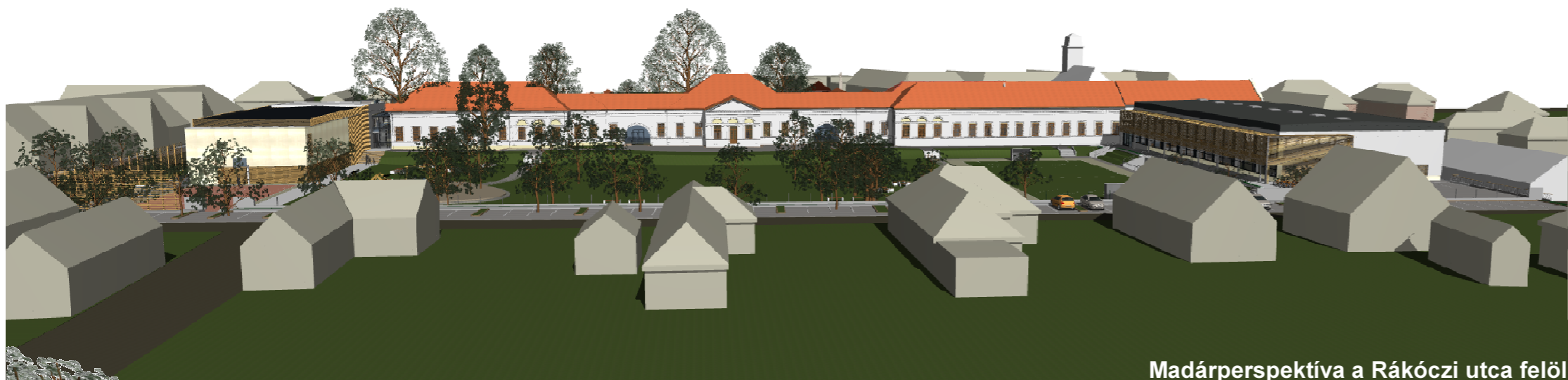
Madárperspektíva a Rákóczi utca felől