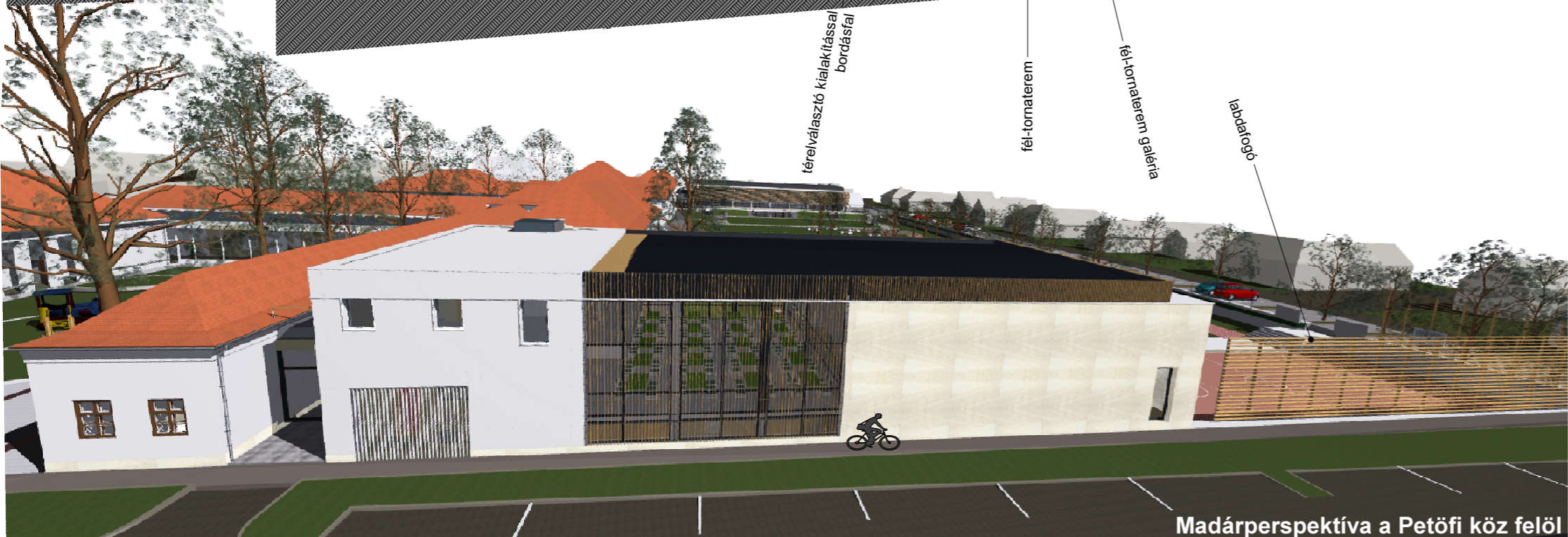
Madárperspektíva a Petőfi köz felől