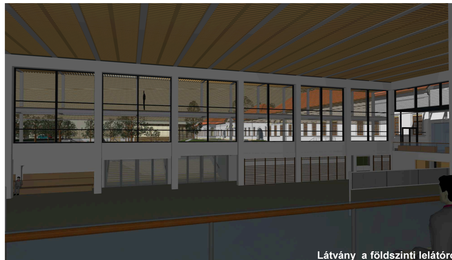
Látvány a földszinti lelátóról