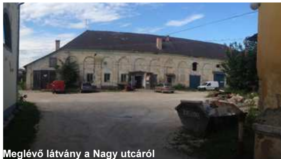
Meglévő látvány a Nagy utcáról