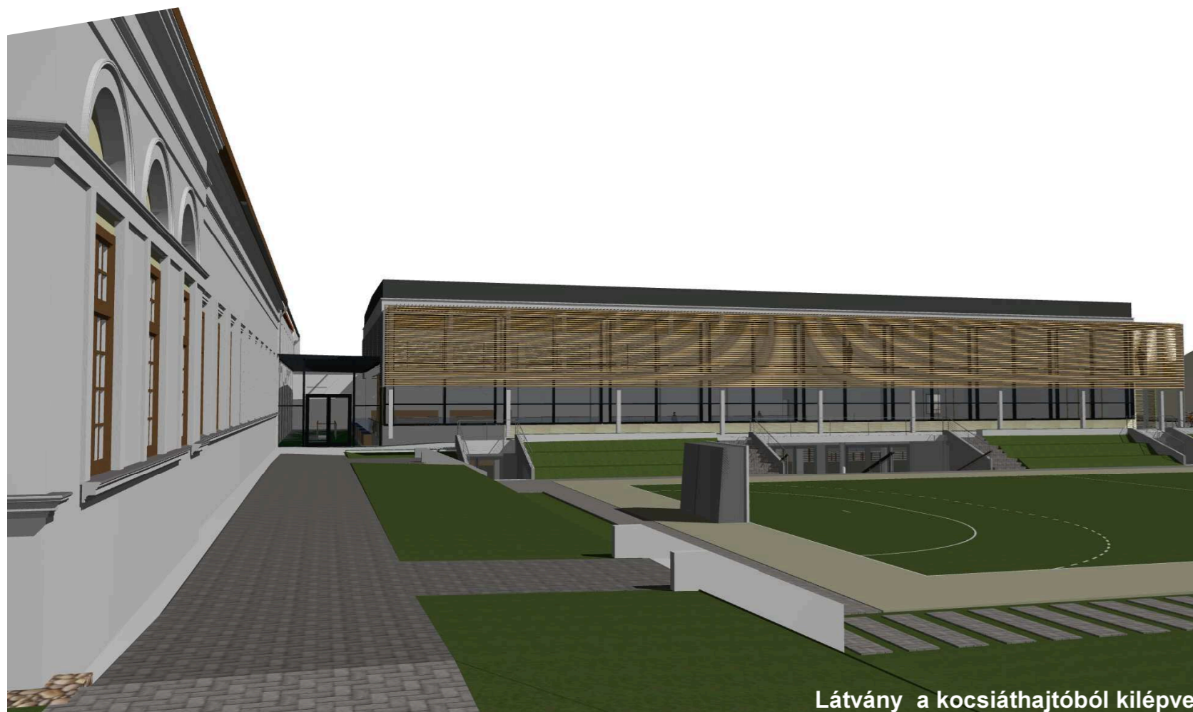
Látvány a kocsithajtóból kilépve