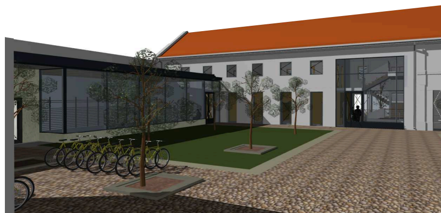
Tervezett látvány a templomépület sarkától