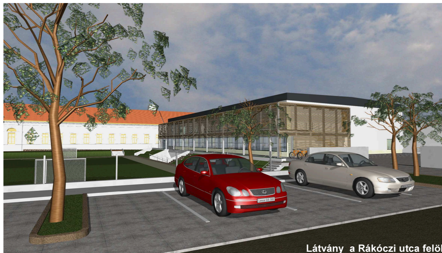
Látvány a Rákóczi utca felől