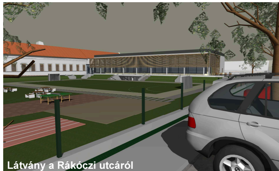
Látvány a Rákóczi utcáról