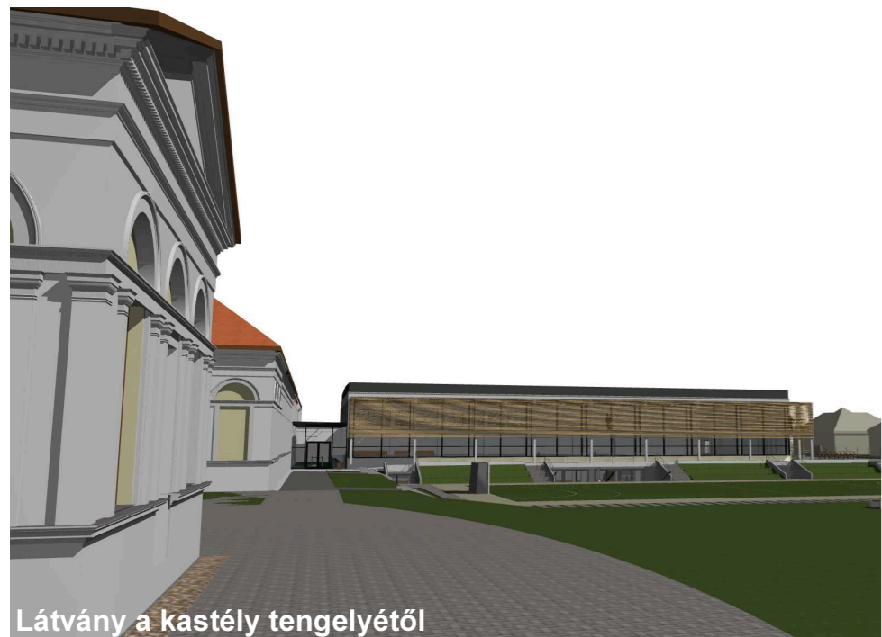
Látvány a kastély tengelyétől