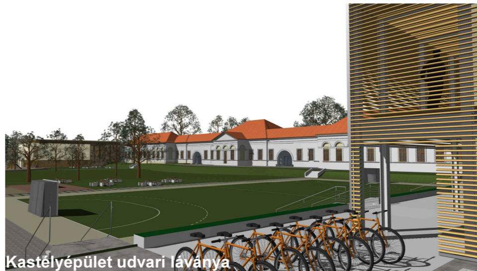
Kastélyépület udvari látványa