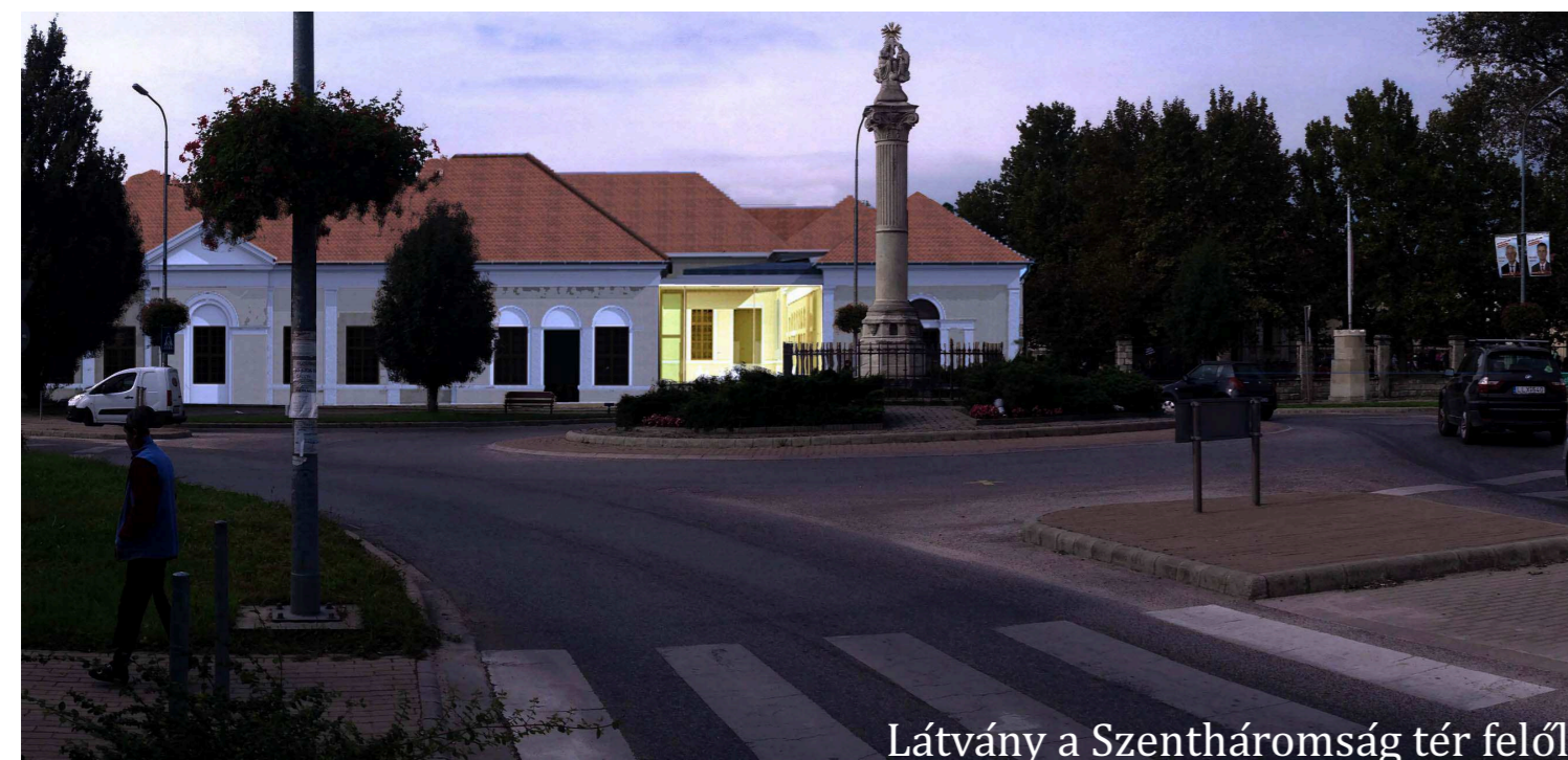
Látvány a Szentháromság tér felől