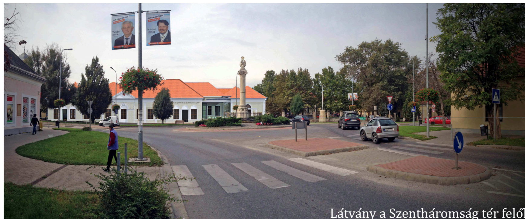
Látvány a Szentháromság tér felől