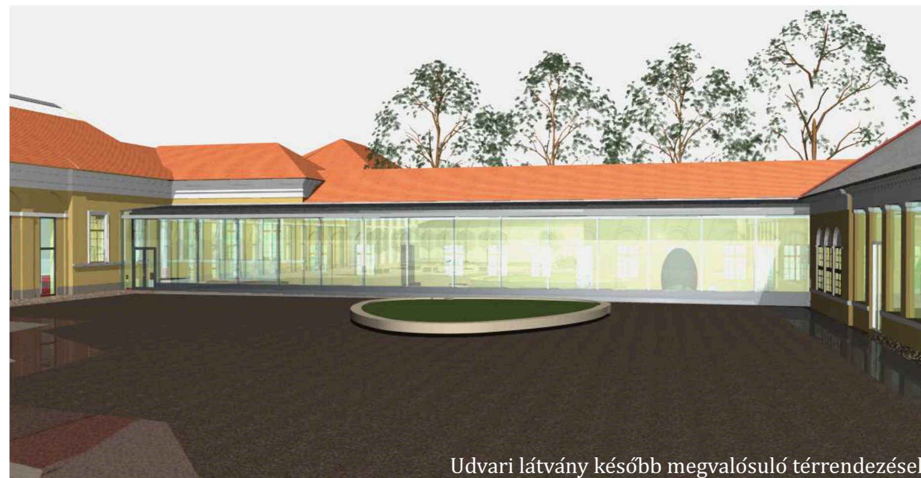
Udvari látvány később megvalósuló térrendezéssel