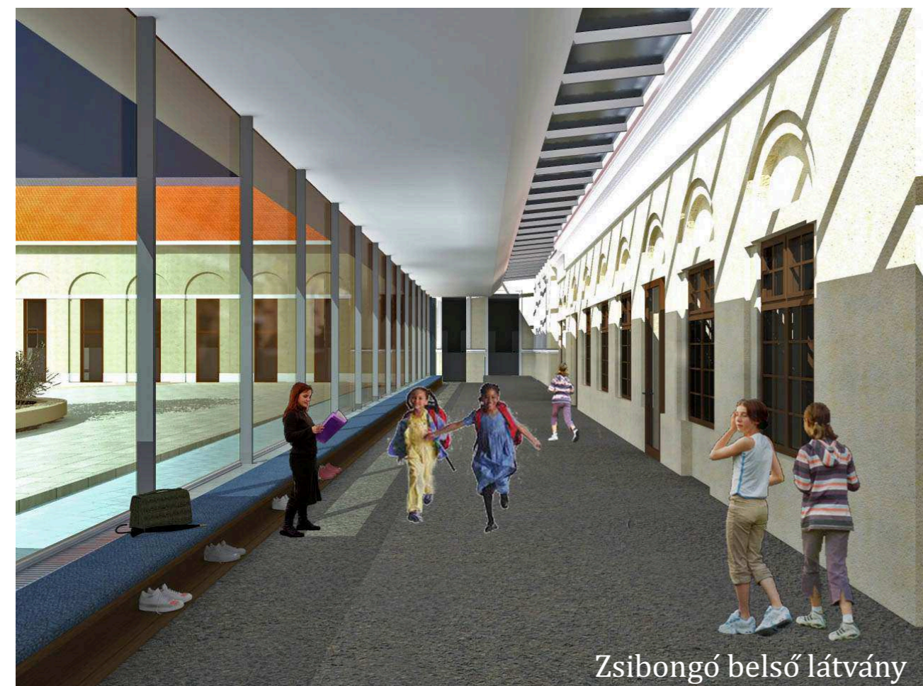
Zsibongó belső látvány