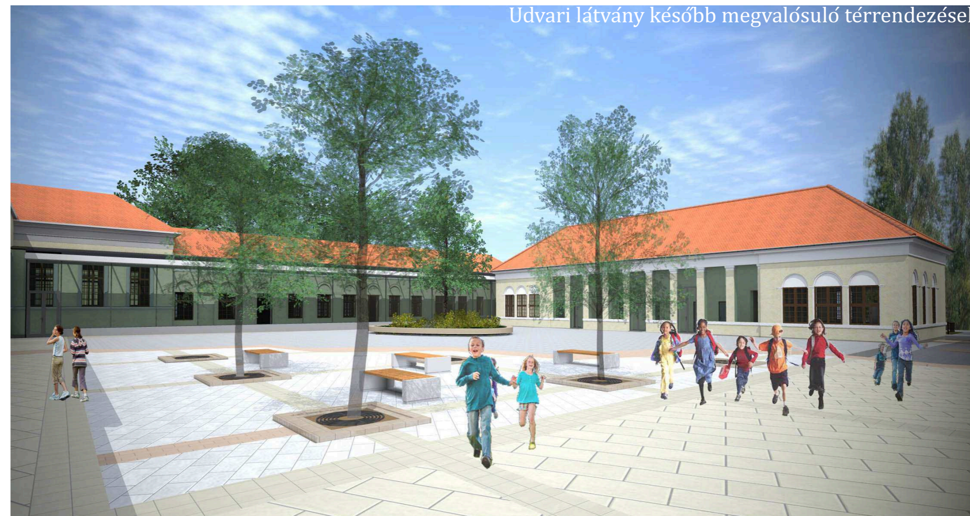
Udvari látvány később megvalósuló térrendezéssel