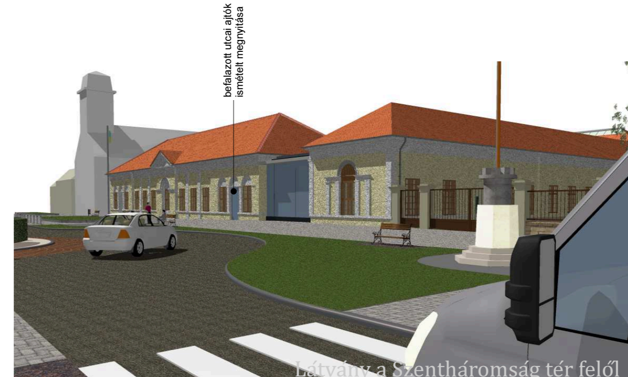
Látvány a Szentháromság tér felől